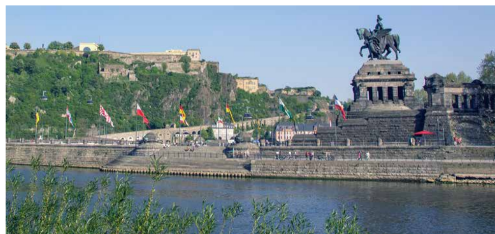
12 kwietnia planowany jest wykład o Nadrenii-Palatynacie. Nz. Deutsches Eck w Koblenzji.

„Sztuczna inteligencja” to temat warsztatów, które pozwolą poznać różne aplikacje możliwe do zastosowania zarówno w życiu prywatnym, jak i w zawodowym. 22 kwiet-