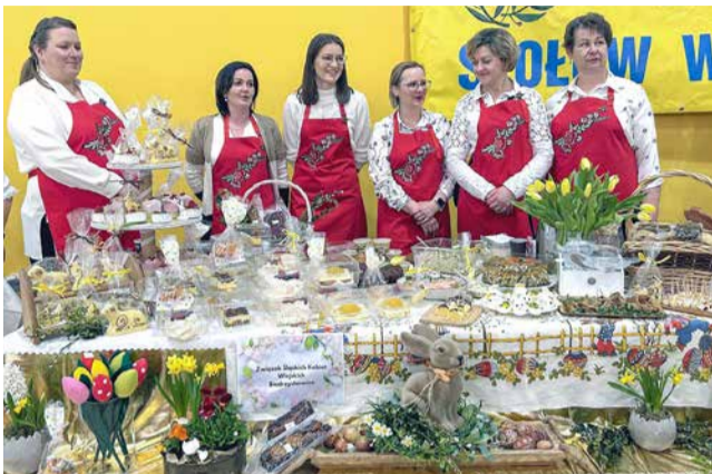
Taki stół przygotowały panie ze Związku Śląskich Kobiet Wiejskich w Biedzychowicach.

Wystawę Stołów Wielkanocnych po raz 24. przygotował Związek Śląskich Kobiet Wiejskich. Towarzyszył jej Jarmark Wielkanocny. Jego gospodarzem był burmistrz Gogolina.