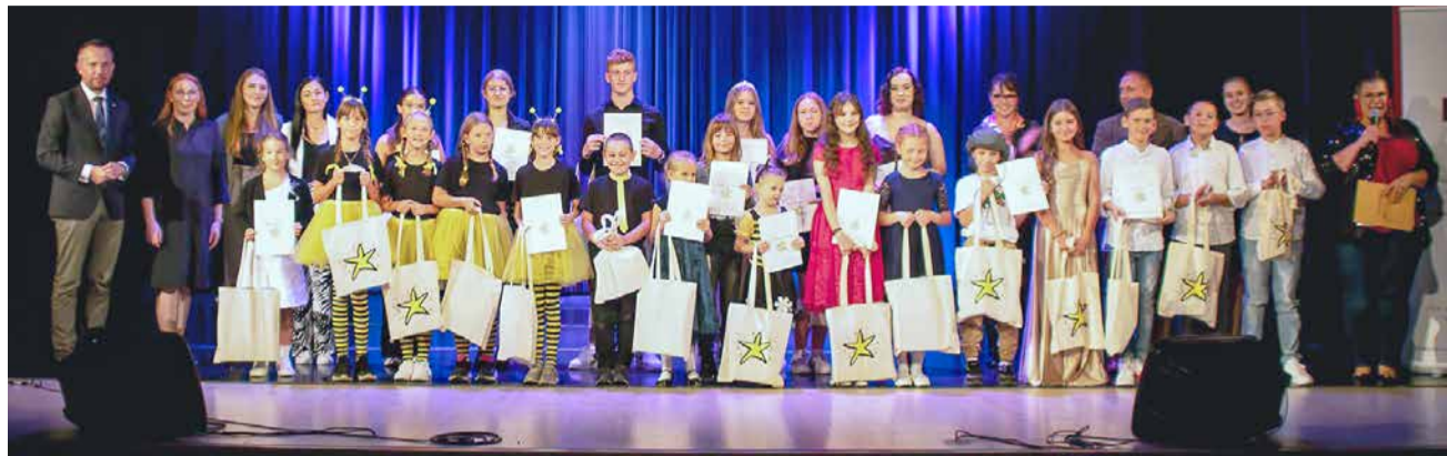
Październik 2023. Podsumowanie Konkursu Superstar 2023.

Drugim etapem i podsumowaniem konkursu będzie